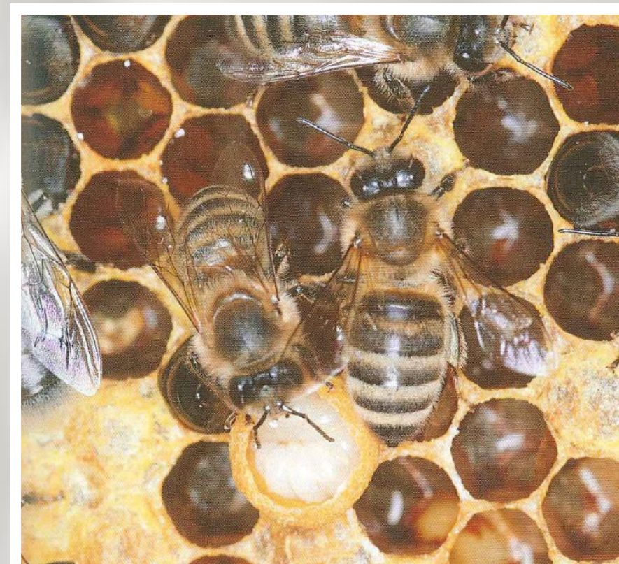
Honingbijvrouwtjes produceren in speciale klieren zustermelk voor het nageslacht.

Enkele dagen later verandert het dieet in bijenbrood, een mengsel van honing en stuifmeel. De larve groeit snel en spint zich na vier vervellingen in. Werkbijen sluiten de cel af met een waslaagje. Na een twaalftal dagen knaagt de volgroeide jonge bij zich naar buiten.