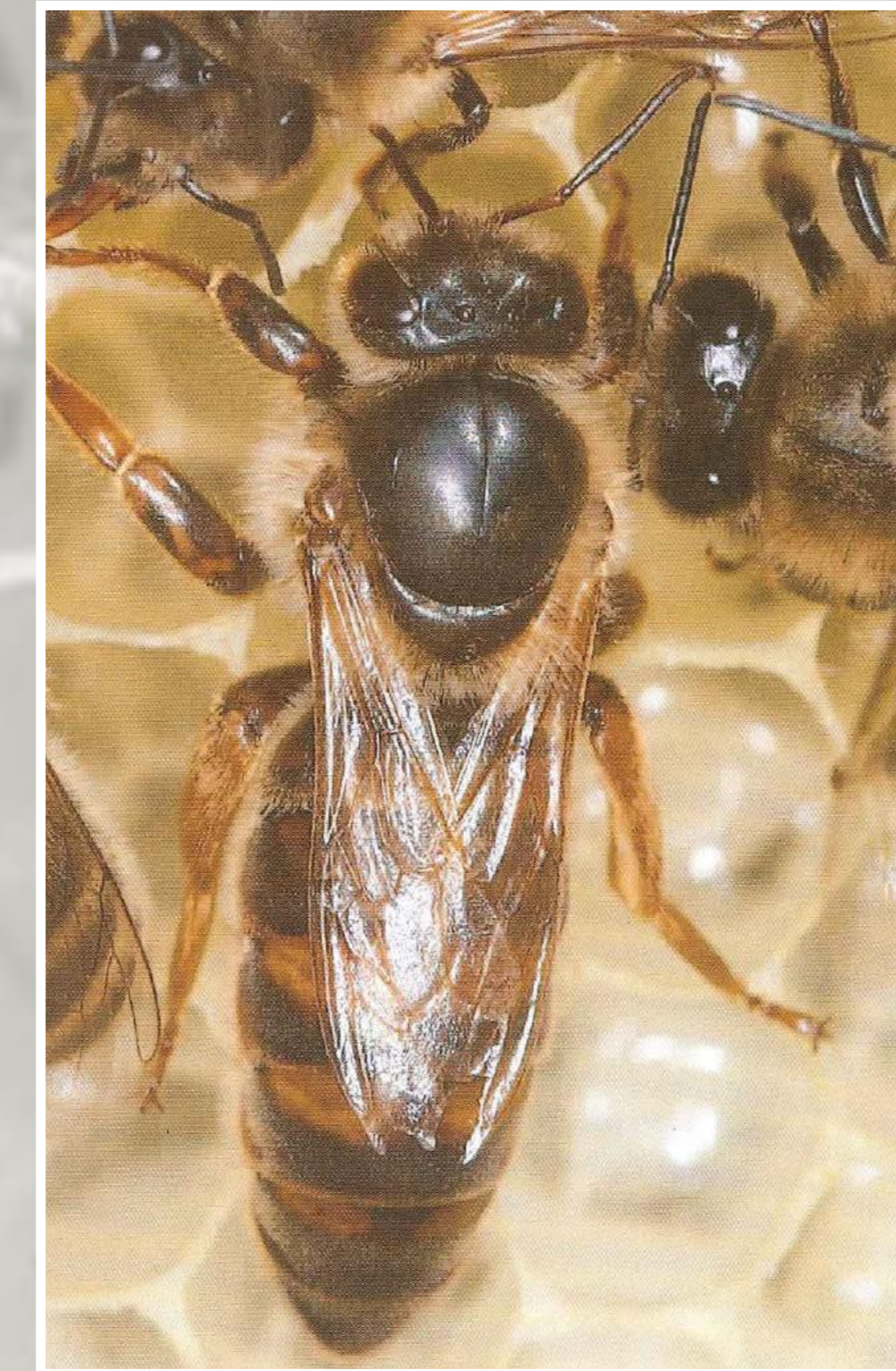
Een bijenvolk heeft slechts één koningin, die goed herkenbaar is aan haar lange achterlijf.

Als ze ongeveer 14 dagen oud is, ontpopt ze zich tot een echte bouwbij. Vanaf dag negentien staat ze in voor de bewaking en de verdediging van het nest. Ook maakt ze haar eerste verkenningsvluchten. In die periode neemt ze ook nectar over van de thuishomende haalbijen. Ze stopt die in honingcellen en met de kop drukt ze binnengebrachte stuifmeelkorrels aan in de voorraadcellen.