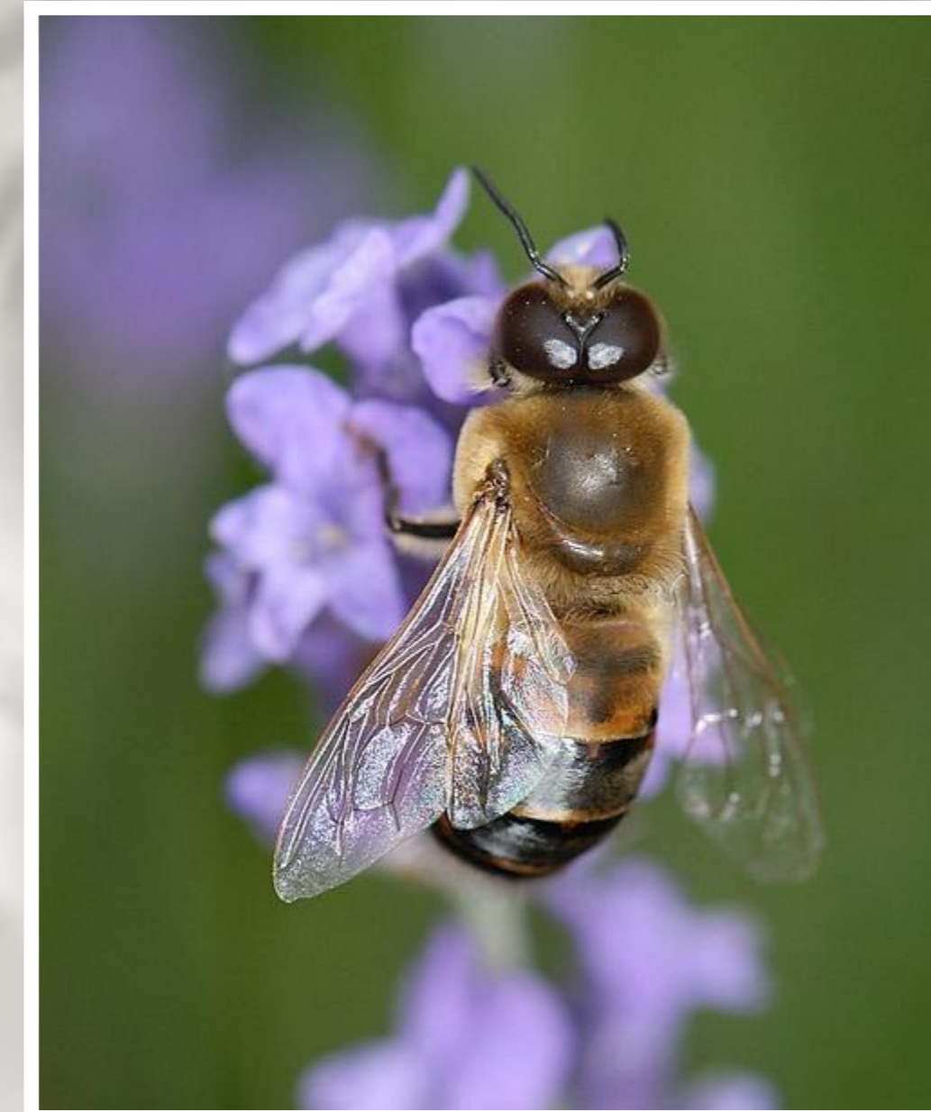
Dar van een honingbij.

De pasgeboren werksterbij gaat al meteen als poetsbij aan de slag. Ze moet de vrijgekomen cellen schoonmaken. Na enkel dagen wordt ze voedsterbij. In het begin geeft ze bijenbrood aan de oudere larven. Later ontwikkelen haar voedersapklieren en kan ze jonge larven bijenmelk geven. De wasklieren van de bij komen tot ontwikkeling tussen haar tiende en twintigste levensdag. Ze scheidt dan aan de onderkant van haar achterlijf wasplaatjes af. Vermengd met speeksel gebruikt ze die voor de opbouw van de wasraten.